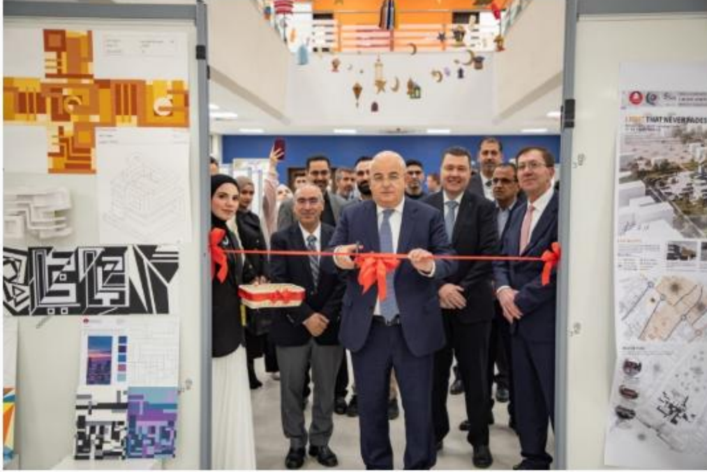
الشريط الإخباري :

خير و صورة | 2026-04-11 | 12:40 pm - السبت